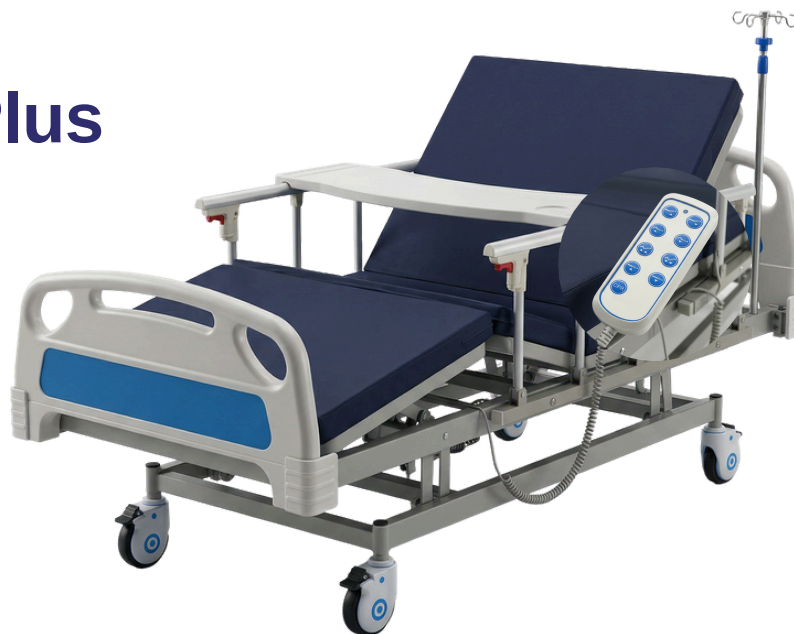
Imagén de referencia.